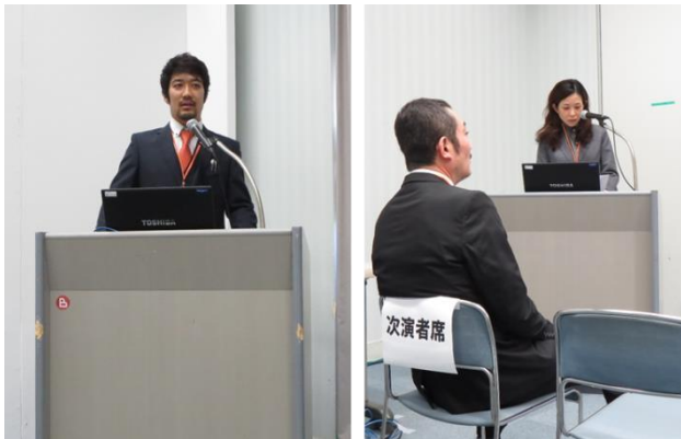
形成外科学会総会

一般演題，シンポジウム，パネル，ランチョンセミナー，座長など全部で7つ，あわただしい3日間でした。