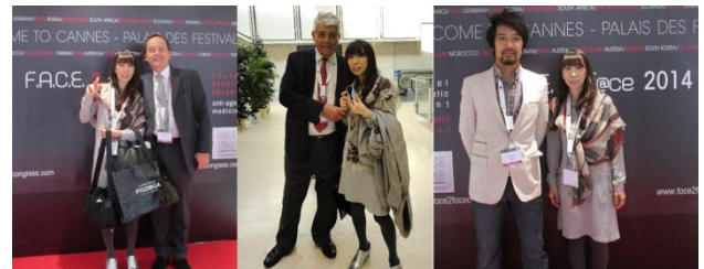
日本美容外科学会

同じ9月に日本抗加齢医学会の分科会である「第8回見た目のアンチエイジング」を主宰しました。