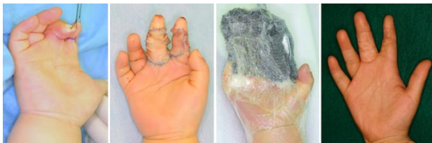
1歳熱傷後瘢痕拘縮の手術(ラップ療法の合併症)

肥厚性瘢痕、傷痕、ケロイド、褥瘡、難治性潰瘍、虚血肢、糖尿病性潰瘍、壊死などの治療を行っている。傷はただくっつけばよいと考えるのは昔、行う治療により、治療経過および残存する傷痕に関係する。形成外科医は傷をきれいに早く治すスペシャリストです。