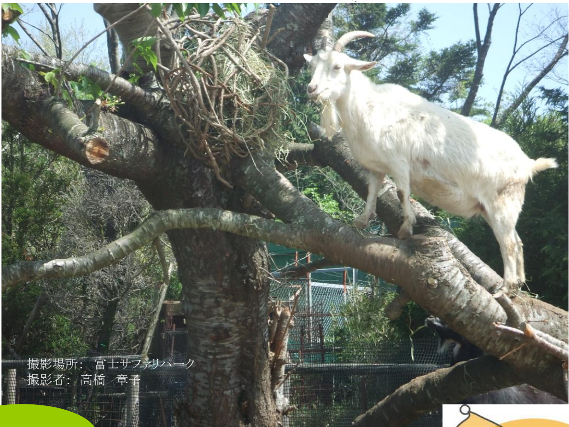
撮影場所：富士サファリパーク