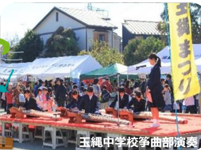
玉縄中学校箏曲部演奏