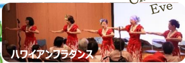
ハワイアンフラダンス