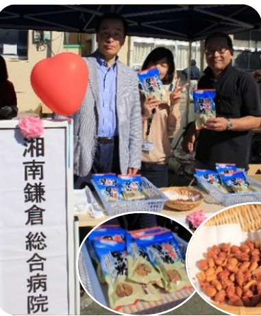
当院も沖縄の物産展として職員がまつりに参加