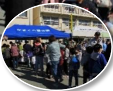
行列ができることも

11月12日土曜日、玉縄小学校にて玉縄まつり実行委員会主催の「第23回玉縄まつり」が開催されました。10時の開会式を皮切りにおまつりがスタート。