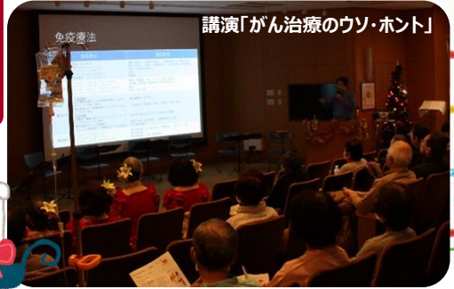
講演「がん治療のウソ・ホント」