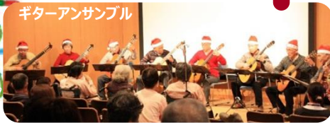
ギターアンサンブル