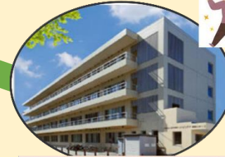
リハビリケア湘南かまくら