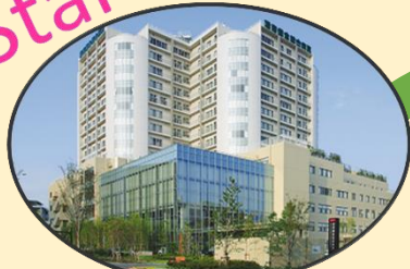
湘南鎌倉総合病院