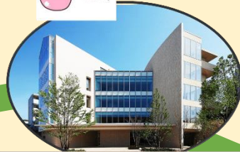
湘南鎌倉パースクリニック