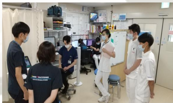
↑救急科医師との症例検討に参加中

実習には専門学校3校、大学1校が来ており、数人でローテーションをしながら朝から晩まで実習に励んでおります。初めての臨床現場とあって、皆さん真剣な眼差しです。