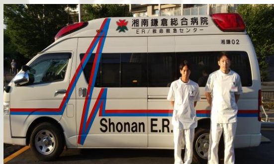
↑ドクターカー前で記念撮影

多数の患者を見れたことでたくさんの学びがあったようです。このモチベーションのまま今後も国家資格取得へ向けて頑張ってもらえたらと思います。