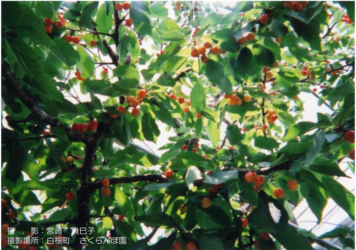
撮影場所：白根町 さくらんぼ園