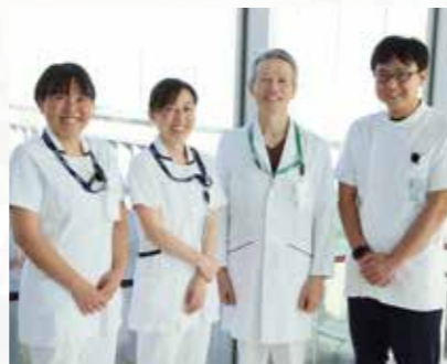
腎臓病総合医療センター 血液浄化センター

当院では、在宅血液透析を希望される患者さんのために、医師、看護師、臨床工学技士がチームとなり、2018年3月から開始しております。在宅血液透析にご興味がある方、話を聞いてみたい方、是非ご覧下さい。